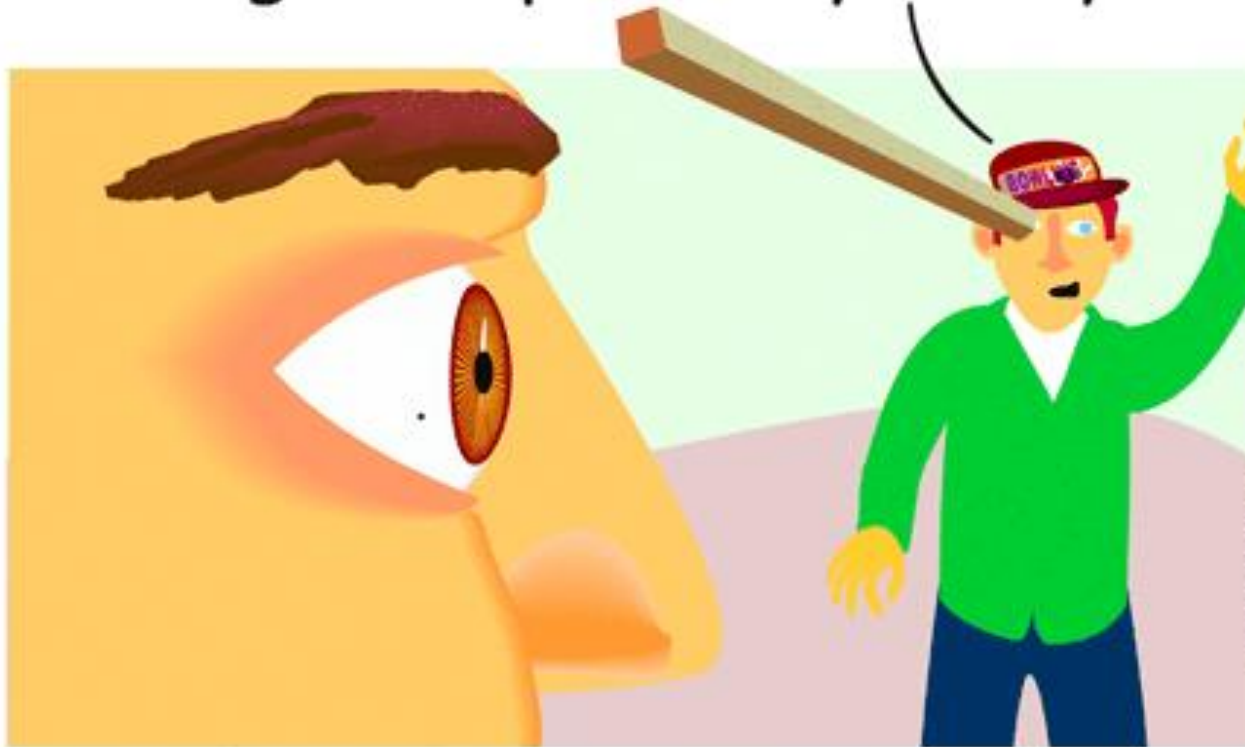
The Speck & the Beam Matthew 7:1-5